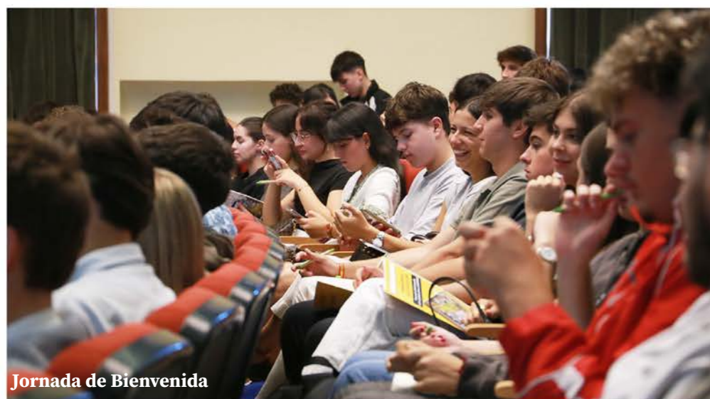
Jornada de Bienvenida