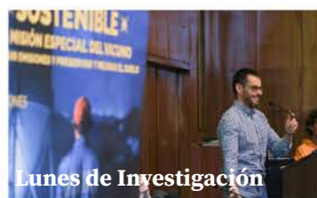
Lunes de Investigación