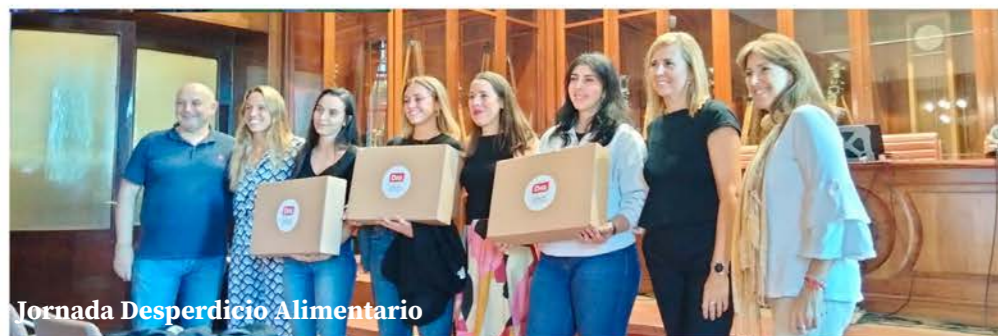
Jornada Desperdicio Alimentario