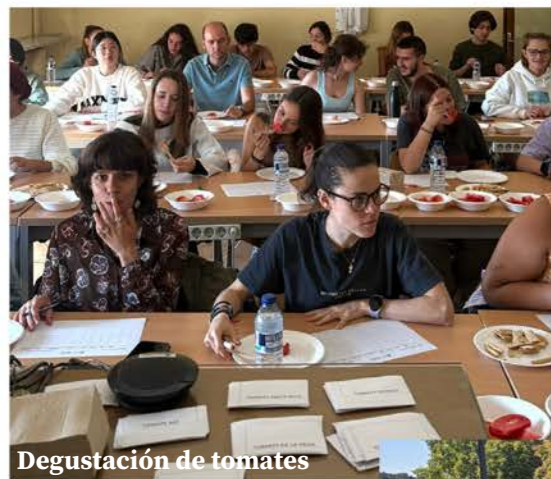
Degustación de tomates