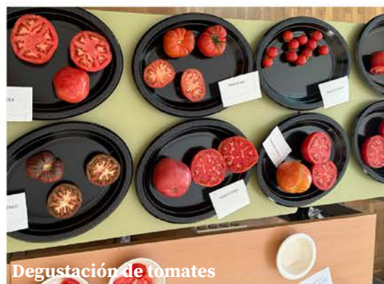
Degustación de tomates