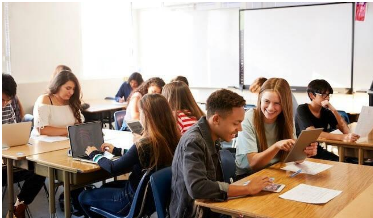
Sala de trabajo alumnos